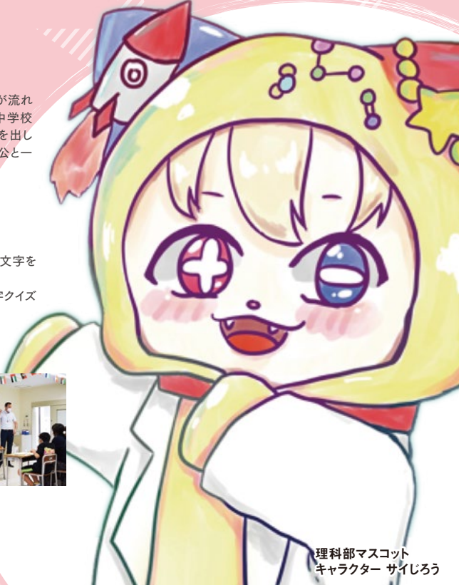
理科部マスコット キャラクター サイジろう

★マークがついている講座は本学の教員が担当します。 それ以外の講座については中学生が司会進行致します。そのため、進行上、ご不便をお掛けする場合がございますが、教育活動の一環としておりますので、ご容赦頂きますようお願い申し上げます。