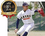
軟式野球部 強化指定クラブ