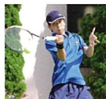
硬式テニス部 ソフトテニス部