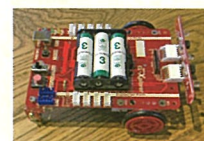
産学連携ロボット

RoboRAVE OSAKA Robotics Education and Competition