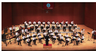
吹奏楽部【強化指定部】