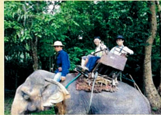
▲海外研修・異文化交流