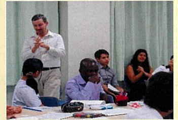
▲英語でのコミュニケーション