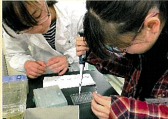
▲文理融合の高度な学び

WWLコンソーシアム構築支援事業・拠点校とは、「これからの新しい社会をリードし、世界で活躍できるイノベティブなグローバルリーダー」を育成する高校として、文部科学省が指定したものです