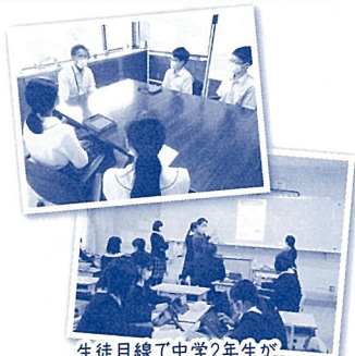
生徒目線で中学2年生が 学校案内パンフレットを制作しました!