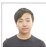
早稲田大学 商学部

刺激を受けながら共に頑張れた！ 私は京都橘で、進路実現に向けて充実した日々を過ごすことができました。それは、志が高ければ高いほど、また、努力をすればするほど応援してくれる学校だったからです。例えば放課後の講座では、難関大学を目指す仲間が集まって授業を受ける機会があり、周りから刺激を受けながら共に頑張ることが出来ました。この経験は志望校合格に欠かせなかったと感じています。