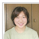
同志社大学 経済学部

物事に挑戦できる環境！ 京都橘は様々な意味で環境が整っています。学習面ではTSゼミや、一般入試の直前期には対策講座が開かれます。先生方は丁寧に質問などに応じてくださる他、進路についての相談にも親身に乘ってくださいます。また、物事に挑戦できる環境があり、僕が2年生の時に英検一級を取得できたのも、このような環境があったからこそだと思います。皆さんも是非目標を持ち、挑戦してください。