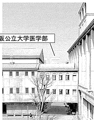
大阪公立大学医学部

中学3年間の勉強を通じて自らの特性を見極め、医師の道へ進路を希望する生徒のため、高校1年生でクラスを編成します。このクラスは、医師体験などの活動および特別演習を必修とし、医師として必用とされる倫理観・職業観を身につけるとともに、特別教材も利用して受験勉強への動機づけに繋がります。