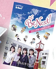
宣真まるわかり！ スペシャルブック