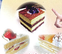
かわいい スイーツ♡