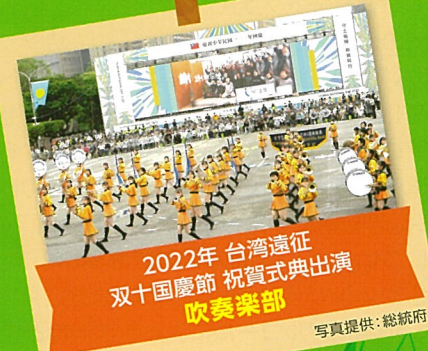
2022年 台湾遠征 双十国慶節 祝賀式典出演 吹奏楽部