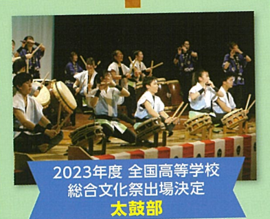
2023年度 全国高等学校 総合文化祭出場決定 太鼓部