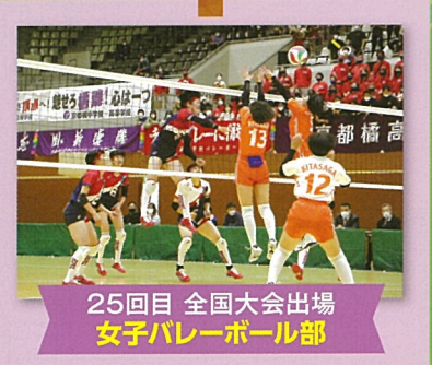
25回目 全国大会出場 女子バレーボール部