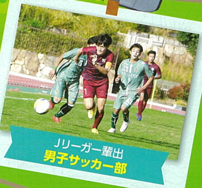
Jリーガー輩出 男子サッカー部