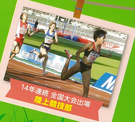
14年連続 全国大会出場 陸上競技部