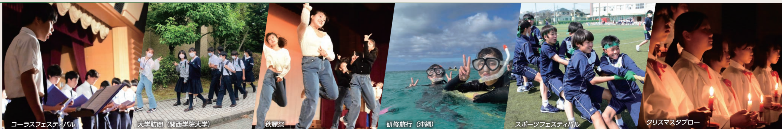
コーラスフェスティバル