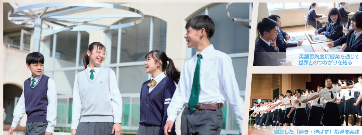
英語習熟度別授業を通じて 世界とのつながりを知る

個性を伸ばし、自信と向上心を大いに培う 主体的・能動的な学びの姿勢と、確かな学力の獲得を目指します