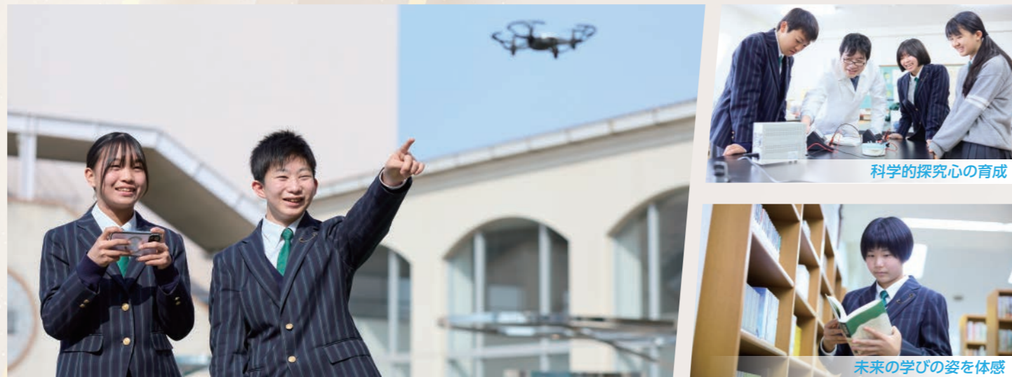
科学的探究心の育成

高校の関西学院大学特進サイエンスコース (KGSSC) への 内部進学優先枠を確保 関西学院大学理系4学部での研究活動につながる素地を育成します。