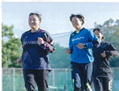
健康スポーツ学科