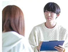
心理カウンセリング学科