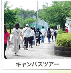
キャンパスツアー