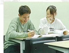
現代ビジネス学科

「太成学院大学」は、 子ども、スポーツ、 カウンセリング、看護、 ビジネスが学べる 大学です!