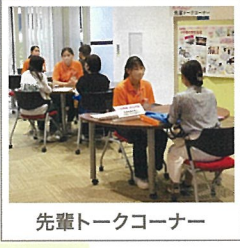
先輩トークコーナー